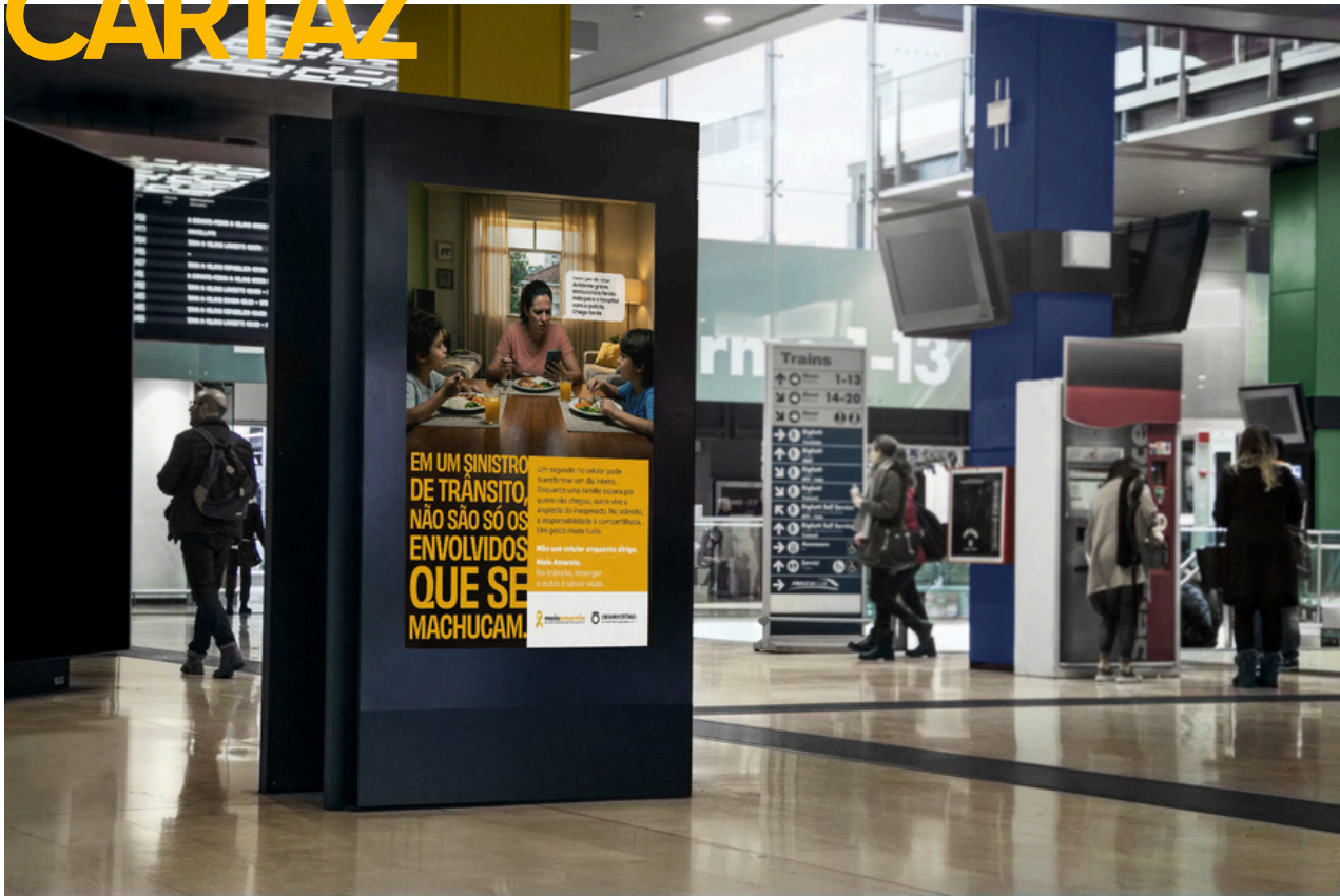
A3 | 29,7 x 42 cm