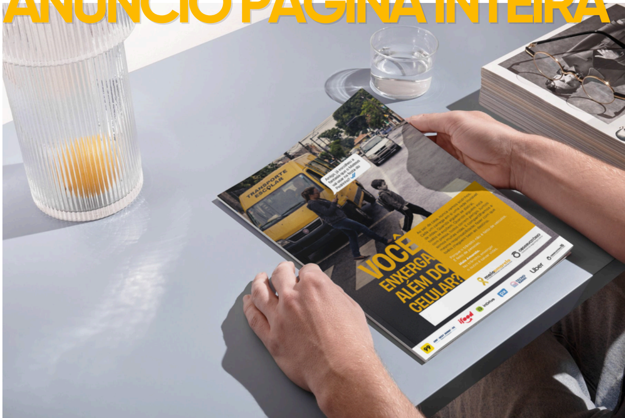
25 x 34 cm